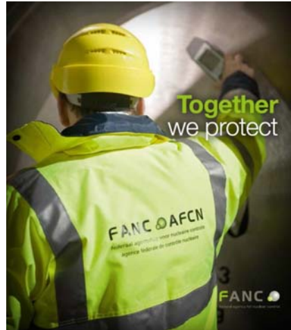
Table ronde - Ronde tafel - 28/02/2019