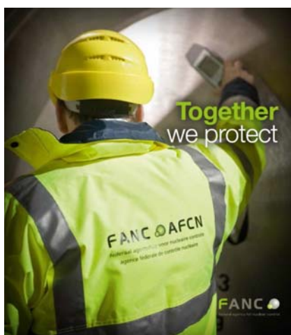
Table ronde - Ronde tafel - 28/02/2019 – Noodprocedure en transportoefening