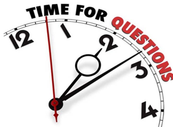
Table ronde - Ronde tafel - 28/02/2019