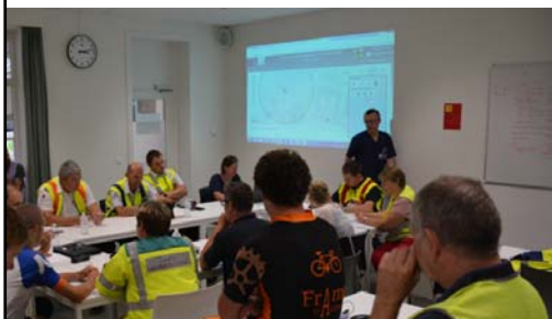
Table ronde - Ronde tafel - 28/02/2019