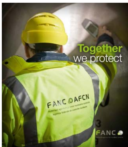
Table ronde - Ronde tafel - 28/02/2019